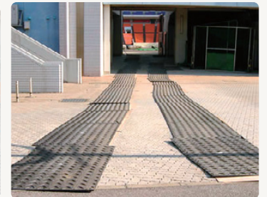
インターロッキング養生