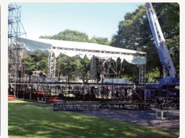
イベントステージ設営