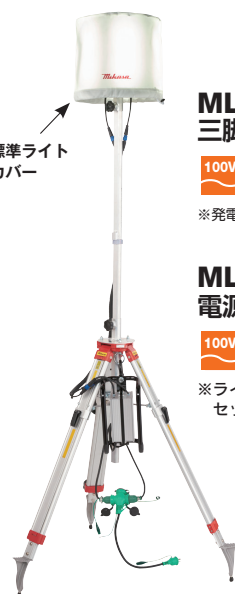
標準ライトカバー