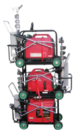
積み重ねが可能です